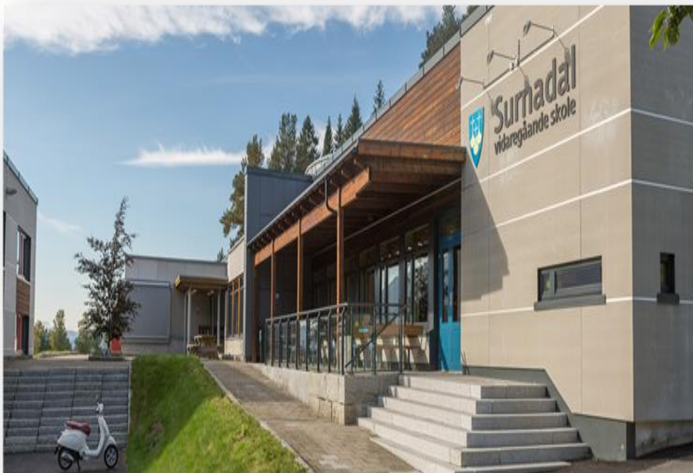
Figur 1 - Surnadal vidaregåande skole